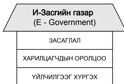
Зураг-1. Электрон засгийн газрын ерөнхий бүтэц

Электрон засгийн газар нь үйлчилгээ хүргэлт, харилцагчдын оролцоо, засаглал гэсэн 3 үндсэн хэсгээс бүрдсэн ерөнхий бүтэцтэй байна. Зураг-1.