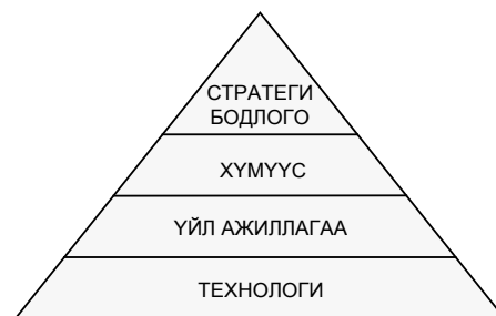
Зураг-3. Хөгжлийн үе шатууд дахь хөдөлгөгч хүчний 4 үндсэн элемент

Эдгээр үе шат бүр нь өөр өөрийн онцлогтой ч, хөдөлгөгч хүч нь 4 үндсэн элементтэй байна. Энэ нь стратеги бодлого, хүмүүс, үйл ажиллагаа, технологи гэсэн элементүүд юм.